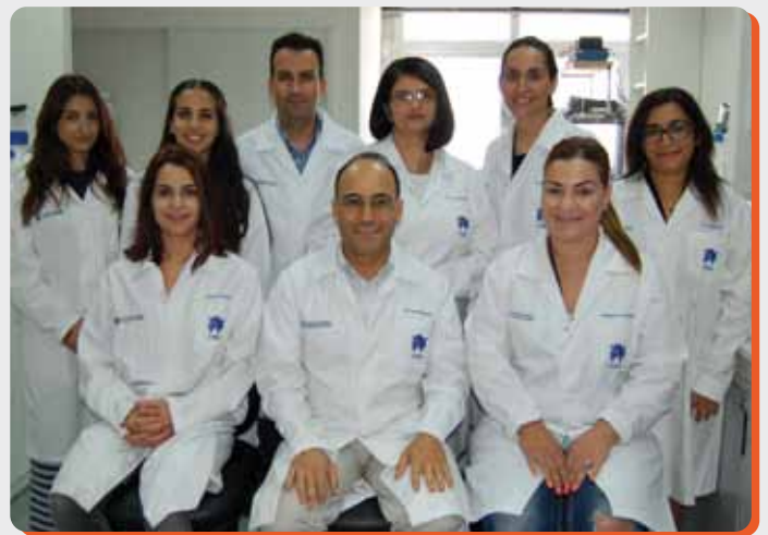
Η Ερευνητική Ομάδα του εργαστηρίου Νευροεπιστημών

Η έρευνα του εργαστηρίου Νευροεπιστημών ΙΝΓΚ παρουσιάστηκε και στο συνέδριο της Ευρωπαϊκής Ακαδημίας Νευρολογίας στο Βερολίνο τον Ιούνιο 2015, όπου έτυχε πολύ θετικών σχολίων και περιλήφθηκε μέσα στις σημαντικότερες νέες ανακαλύψεις που επιλέχθηκαν να παρουσιαστούν ξανά στη λήξη του συνεδρίου. Για την παρουσίαση αυτή, έχει επίσης απονεμηθεί στο Δρ. Κλεόπα το βραβείο Έρευνας 2015 της Ευρωπαϊκής Ακαδημίας Νευρολογίας για τις νευροπάθειες.